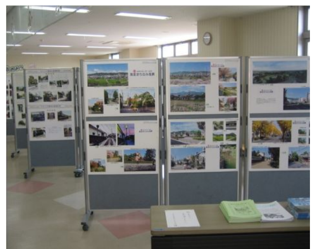
続・まちなみパネル展