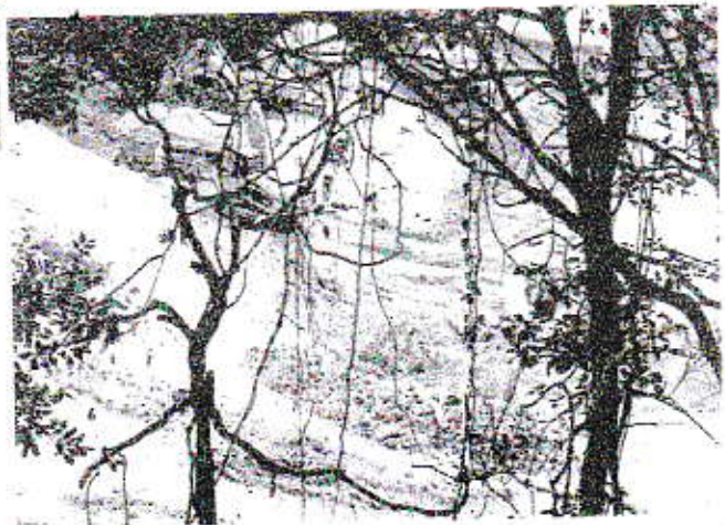
霊園入口工事現場