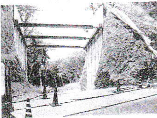
霊園造成工事現場

樹木が茂り土留めが行われているが、建設に伴って擁壁が造られると考えられるが、頑強に造られることを願う。勿論、箕面市も厳格な施工指導を行っていると思えるが、昨今の異常豪雨が各地を襲うニュースを耳にするにつけ、気になる。